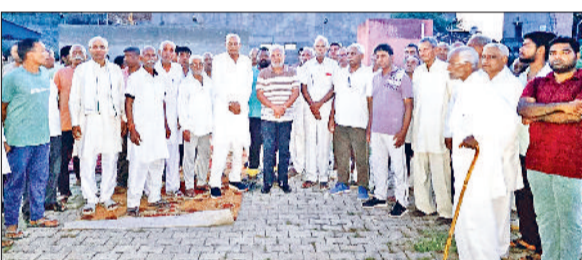
रोहतक। सामुदायिक केंद्र में पंचायत करते हुए कॉलोनीयों निवासी।

कन्हेली रोड स्थित सामुदायिक केंद्र में हुई इस पंचायत में अंबेडकर कॉलोनी, ग्रीन पार्क कॉलोनी, राजीव नगर, एकता कॉलोनी के