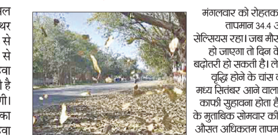
यह लगभग सामान्य है। न्यूनतम औसत तापमान में 0.2 सेंटीग्रेट की वृद्धि हुई तो पाया गुरुग्राम में पारा 23.8 डिग्री सेल्सियस दर्ज किया गया। ये प्रदेश में सबसे कम था।

करीब एक महीने के बाद मंगलवार अल सुबह मौसम में बड़ा बदलाव हुआ। मंथर गति से पछुआ चलनी शुरू हुई। दिनभर 8 से 10 किलोमीटर प्रति घंटे की रफ्तार से चलती रही। अगले 48 घंटे तक भी ये हवा चलती है तो फिर ये उम्मीद की जा सकती है कि हाल-फिलहाल में बरसात नहीं होगी। अगर हवा का रुख बदलकर फिर से पूर्वा का होता है तो मौसम गड़बड़ा भी सकता है। हवा को निरोगी इसलिए कहा जाता है, जब ये चलती है तो तापमान में गिरावट आ जाती है। पश्चिम दिशा की ओर से आने वाली पछुआ हवा के चलने पर हर मौसम में ठंडक महसूस होती है। जब सर्दियों में ये चलती है तो तापमान तेजी से गिरने लगता है। ध्यान ये भी रहे कि प्रदेश से 20 सितंबर तक मानसून की वापसी की उम्मीद की जा रही है। उससे पहले कभी भी बरसात हो सकती है।