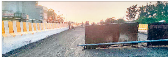
रोहतक। पुल बनकर हुआ तैयार, दीवारों पर कराया पेंट तथा पुल की दोनों दीवारों पर की गई सुंदर पेंटिंग।

पहले बने फ्लाईओवर की दीवारों पर रंग-बिरंगी पेंटिंग से नया रूप दिया गया है, अधिकारियों का कहना है कि मुख्यमंत्री के दौरे से पहले सारी तैयारियां पूरी हो जाएंगी।