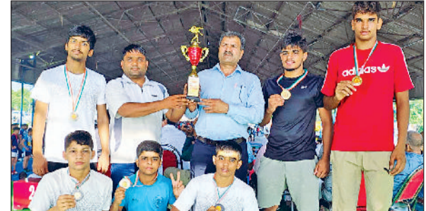
रोहतक। विजेता खिलाड़ी ट्रॉफी और मेडल के साथ।